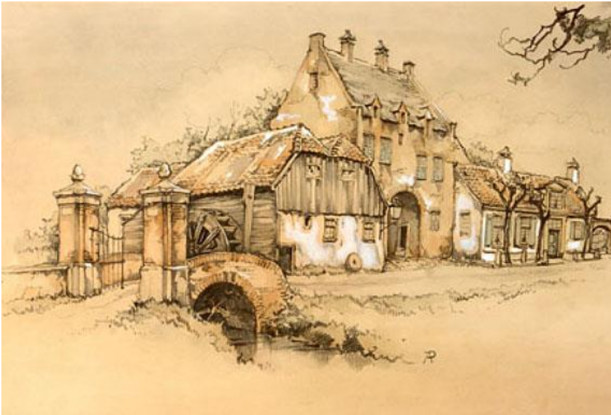
schetsontwerp van Anton Pieck van de ingang van het recreatiepark Genneper Molen (eind 50-er jaren)

Eind vijftiger jaren had men grootse plannen voor de molen en omgeving. De Culturele Raad diende een plan in voor een grootscheeps recreatiegebied waar de molen deel van uitmaakte. Anton Pieck maakte schetsontwerpen. Het recreatiegebied was bedoeld als vermaak voor jongeren, het park zou een sporthal, cafetaria met dansgelegenheid, een heemkundig museum, sportvelden, een rolschaatsbaan en een overdekt zwembad moeten huisvesten. De plannen zijn verzand.