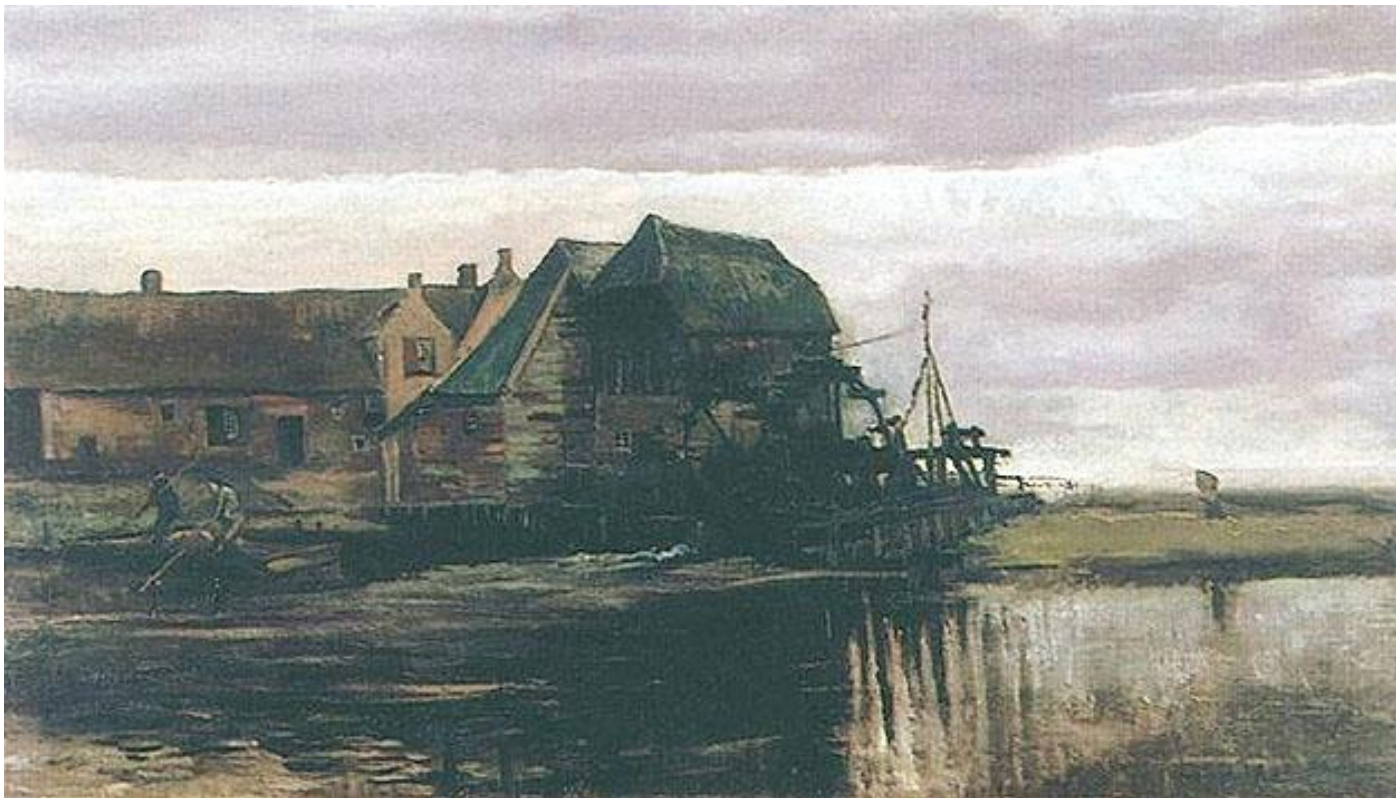
Schilderij Gennep Molen van Vincent van Gogh (november 1884; Museum Thyssen-Bornemisza, Madrid)

Van Gogh schreef in november 1884 aan zijn broer Theo: 'Dezer dagen ben ik ondanks het hier vrij ter deeg vriest, nog buiten aan 't werk, aan een nogal groote studie (meer dan 1 meter) van een oude watermolen te Gennep, aan den anderen kant van Eindhoven. Ik wil dat geheel buiten afwerken, maar 't zal ook wel 't laatst zijn dat ik dit jaar buiten schilder.' Een brief later meldt hij: 'Waarde Theo. Gisteren bracht ik juist thuis die studie van den watermolen te Gennep, waar ik met plezier aan heb gewerkt.'